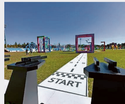
Les pilotes doivent faire passer leurs machines à travers des portes.

la machine soit pris en considération pour des questions d'accélération et de maniabilité.»